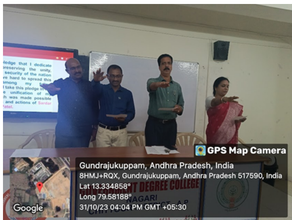
Staff and students taking the pledge