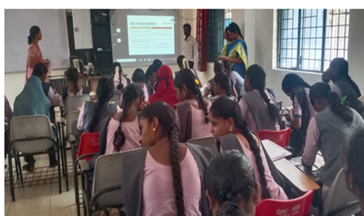
Cyber Smart Certification Programme 26-10-2023 & 27-10-2023