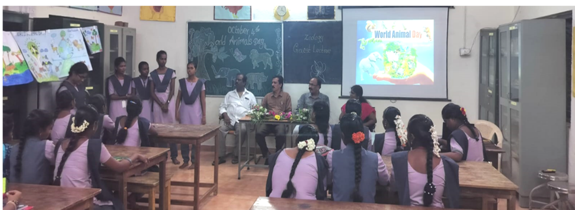
Prize distribution to Poster winners