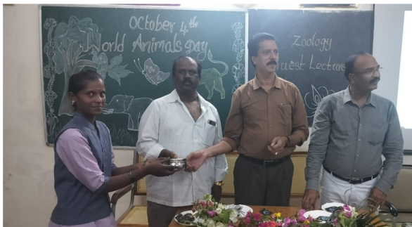
Prize distribution to winner in Elocution