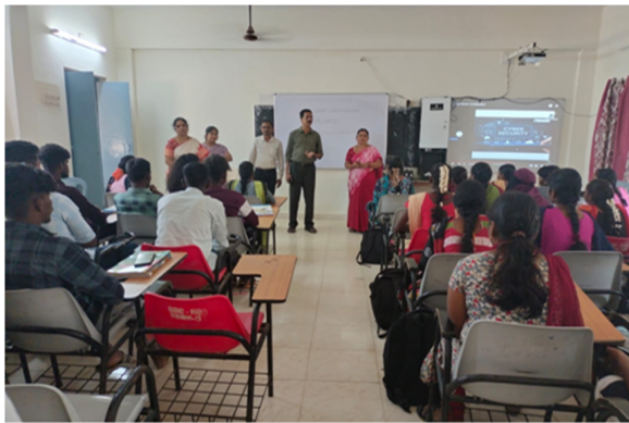
Cyber Smart Certification Programme 26-10-2023 & 27-10-2023