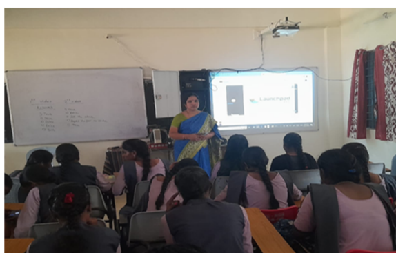
Cyber Smart Certification Programme 26-10-2023 & 27-10-2023