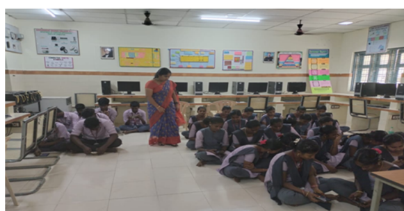
Cyber Smart Certification Programme 26-10-2023 & 27-10-2023