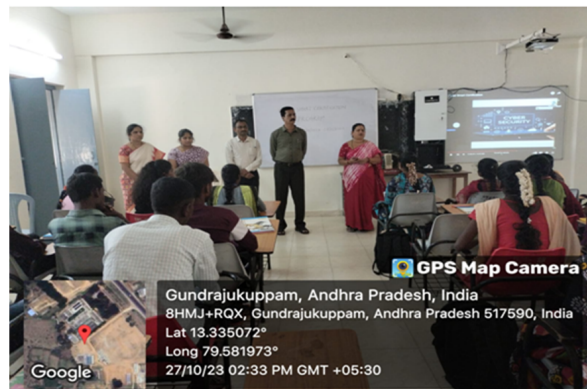
Cyber Smart Certification Programme 26-10-2023 & 27-10-2023