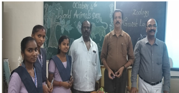
Quiz competition winners