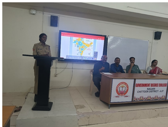
Ms.Vennela presenting her words on the importance of the day.